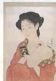
橋口五葉 化粧の女 大正7年(1918)