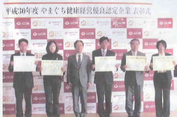
県知事表彰を受けられた企業様

総合部門：村田株式会社 様（防府市） 歯科部門：株式会社ウエムラエナジー 様（岩国市）